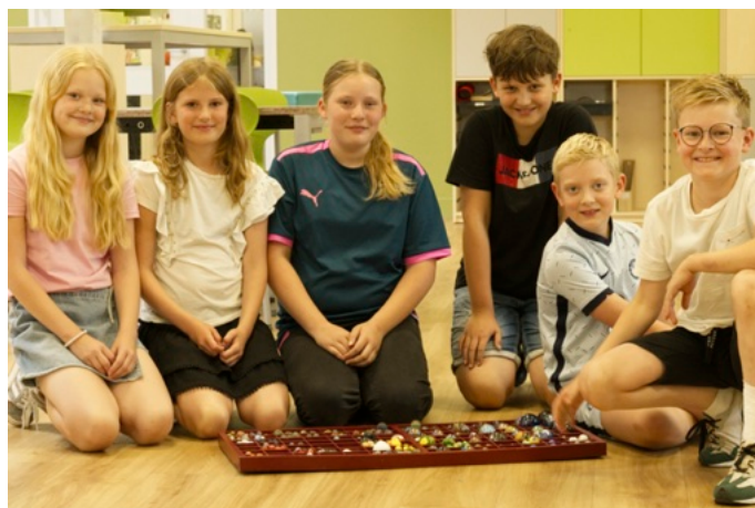
De leerlingen van de leerlingenraad

"Om aan materialen te komen, deden we een oproep in ons eigen netwerk aan ouders en oud-medewerkers, maar ook via de lokale media. Mensen kwamen allerlei spullen brengen: oude schriftjes met prachtig handschrift, oude schoolboeken, handwerkjes, foto's van vroeger en zelfs de letters CVO die ooit aan de gevel hingen. Deze letters stonden voor Christelijk VolksOnderwijs, de allereerste naam van de school. Ook aan schoolbank.nl hebben we veel gehad."